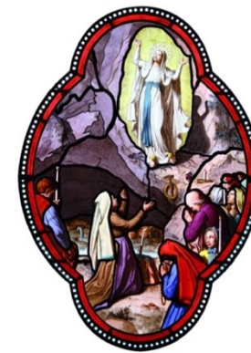
18 maart 1858, 16 de verschijning: "Ik ben de Onbevleete Ontvangenis"